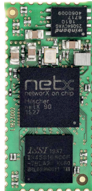
Das lötbare Kommunikationsmodul ,netRapid 90' von Hilscher

Zu Beginn stand ein gemeinsamer Workshop von Brückmann als Auftraggeber und Burger Engineering als für die Entwicklung zuständiger Partner. Dabei wurde der technische Rahmen für das Projekt abgesteckt und entschieden, ob ein Companion Mode oder eine Stand-alone-Lösung mit SPI-Anbindung geeigneter wäre. Nach Analyse der Controllerbelastung fiel die Entscheidung zugunsten der Stand-alone-Variante mit SPI-Spiegelung. Die Applikation wurde vollständig auf dem Application Core des Hilscher netRapid 90 realisiert. Der Entwicklungspartner übernahm die komplette Umsetzung der Applikation und arbeitete in der Frühphase mit Evaluationsboards, um unabhängig von der Zielhardware zu testen. Parallel lieferte Hilscher den Profinet-Protokollstack passend zur netRapid-90-Hardware zu.